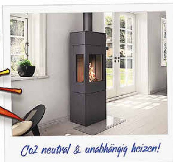
Co2 neutral & unabhängig heizen!

Bis zu 1500,-€ Ersparnis auf Ausstellungsgeräte!