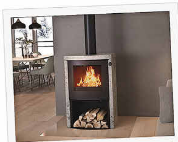
Sichere dir deinen Platz am Feuer!

Du findest bei uns eine große Auswahl an Kaminöfen, Kachelöfen, Herde und Gartenfeuer.