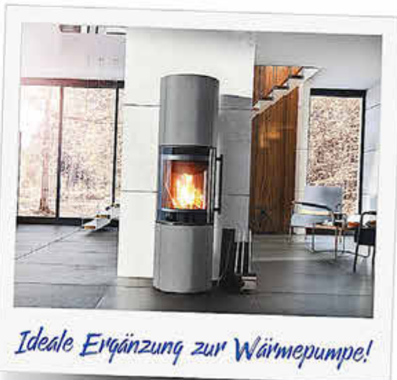
Ideale Ergänzung zur Wärmepumpe!

Jetzt zuschlagen & für Gemütlichkeit im nächsten Winter sorgen!